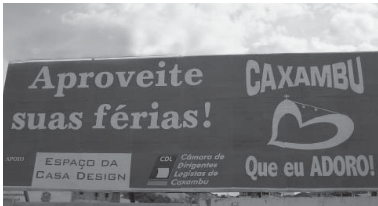
Um dos outdoors de “boas vindas” colocados na Av. Ápio Cardoso

Outras campanhas, nesses moldes, deverão ser realizadas neste segundo semestre.